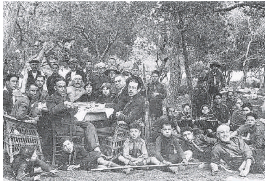
Campament dels Exploradores de España, final dels anys 20.

Carlos Mir i Orfila (1916-1983) avui és recordat gràcies al centre de la Fundació de Persones amb Discapacitat de Menorca, que du el seu nom